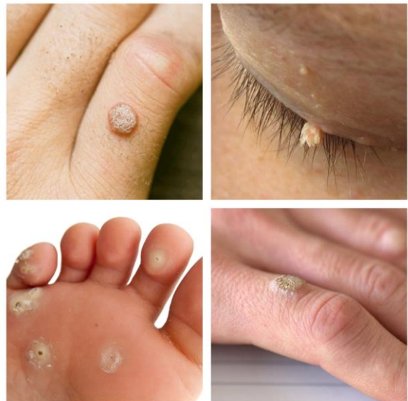
تصویر ۲. نمای پوستی گوناگون ویروس پاپیلومای انسانی (زگیل پوستی) [۴۱].

طبق مطالعات انجام شده از سوی سازمان CDC 7 ، در طول سال‌های ۲۰۱۴-۲۰۱۳، هر گونه شیوع HPV تناسلی در میان بزرگسالان ۱۸ تا ۵۹ ساله، ۴۲.۵٪ در کل جمعیت (۴۵.۲٪ در میان مردان و ۳۹.۹٪ در میان زنان) بود. شیوع HPV تناسلی پرخطر ۲۲.۷ درصد در کل جمعیت (۲۵.۱ درصد در مردان و ۲۰.۴ درصد در میان زنان) بود. شیوع هر گونه HPV تناسلی در بین مردان بیشتر از زنان و در میان بزرگسالان بود. این الگو برای بزرگسالان نیز مشابه بود، اما تفاوت بین مردان و زنان از نظر آماری معنی‌دار نبود [۳۲]. در طی سال‌های ۲۰۱۱-۲۰۱۴، شیوع هر گونه HPV دهانی در بین بزرگسالان ۱۸ تا ۶۹ سال ۷.۳٪ و HPV دهانی پرخطر ۴.۰٪ بود. شیوع HPV دهانی ۸ پرخطر در مردان به طور قابل توجهی بیشتر از زنان در هر نژاد و گروه بود. شیوع بالاتر در مردان نسبت به زنان نیز در مطالعه قبلی NHANES 9 ، ۲۰۱۰-۲۰۰۹ گزارش شده بود [۳۲]. این گزارش آخرین تخمین‌ها از شیوع HPV را ارائه می‌کند که هم محل‌های دهان و هم ناحیه تناسلی را بر اساس جنسیت و نژاد بررسی می‌کند. NHANES شامل جمعیت‌هایی نمی‌شود که ممکن است در معرض خطر بالاتر ابتلا به HPV در نظر گرفته شوند (به عنوان مثال، افرادی که در نهادها، زندانی، در مراکز مراقبت طولانی مدت غیر بیمارستانی، استفاده از مواد مخدر تزریقی، و افراد بی خانمان و غیره). بنابراین، این داده‌ها تخمین‌های محافظه کارانه‌ای از میزان شیوع HPV دهانی و تناسلی در میان بزرگسالان ایالات متحده ارائه می‌دهد. سایر گزارش‌های اخیر از شیوع HPV از NHANES، تأثیر برنامه واکسیناسیون HPV ایالات متحده بر شیوع HPV در بین زنان و اولین داده‌ها در مورد شیوع HPV در بین مردان را بررسی کرده است [۳۲]. عفونت HPV بخصوص در جوامع غربی در زنان جوان بسیار شایع است.