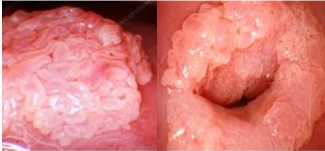
تصویر ۳. نمای ضایعه مخاطی دهانه رحم ناشی از ویروس پاپیلومای انسانی (زگیل تناسلی) [۴۲].

موکوسی (تصویر ۳) آن‌ها می‌توانند زگیل‌های تناسلی و انواعی از سرطان‌ها را ایجاد نمایند. این ویروس‌ها شایع‌ترین عامل عفونت منتقله از طریق جنسی می‌باشند [۳۵،۳۶].